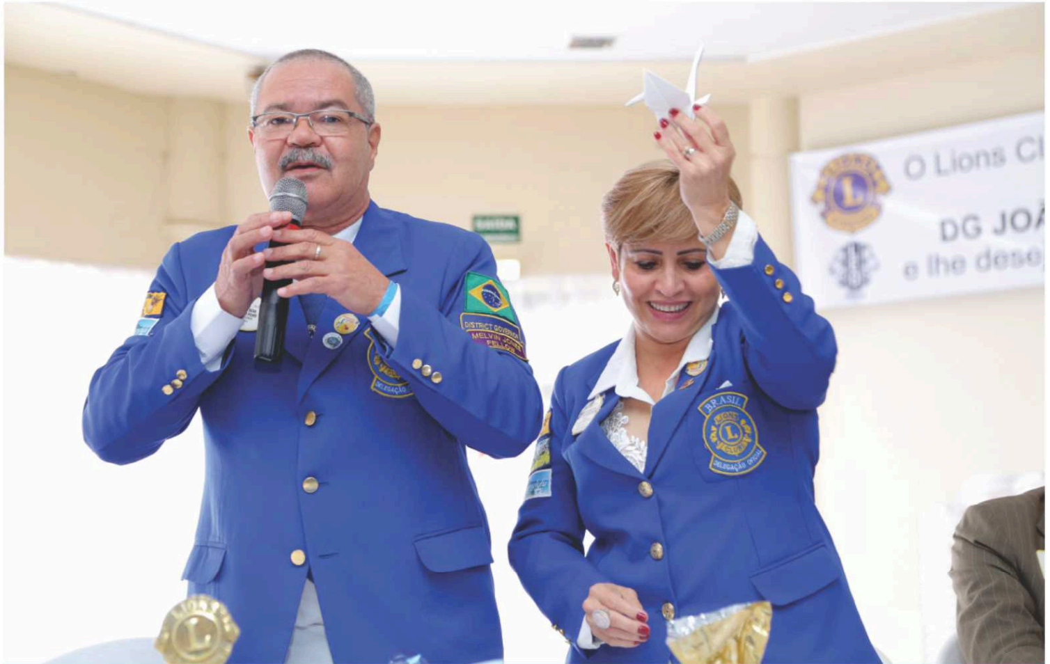
Durante a reunião, realizada em Cuiabá, aconteceram seminários para dirigentes de clubes (presidentes, secretários, tesoureiros, diretor social, diretor de associados e leão conselheiro LEO).