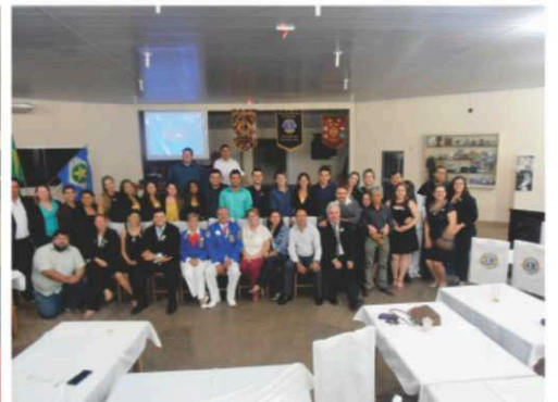
LC Alta Floresta