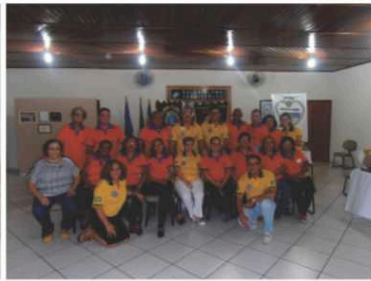
LC Rondonópolis São José Operário