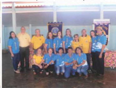
LC Nova Xavantina