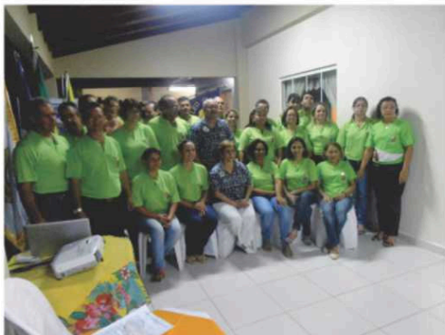
LC Cáceres Portal do Pantanal