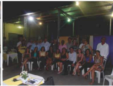
LC Quatro Marcos