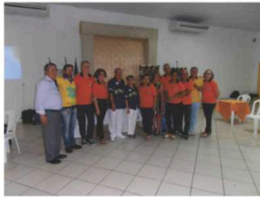
LC Cuiabá Leste