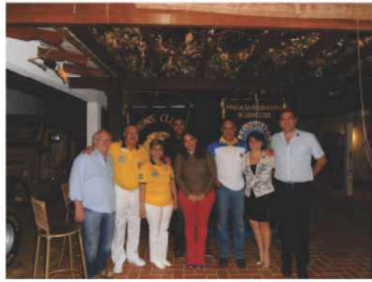
LC Várzea Grande