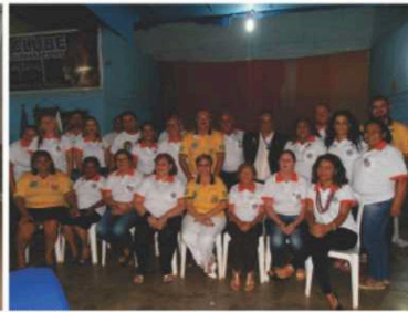
LC Chapada dos Guimarães