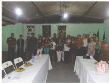
LC Água Boa