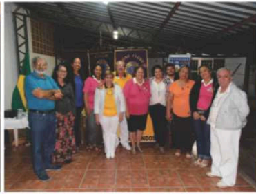
LC Várzea Grande Flor do Cerrado