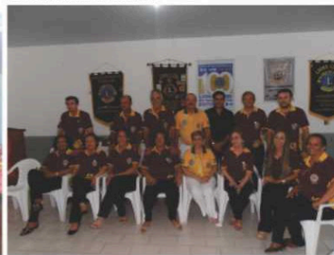
LC Pedra Preta