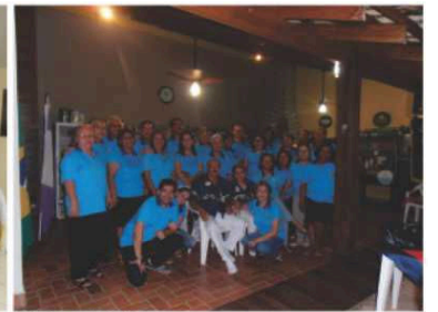
LC Cuiabá Norte