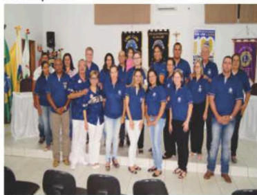
LC Nova Guarita