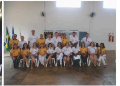
LC Primavera do Leste