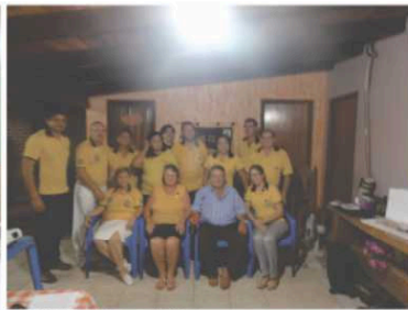
LC Porto Esperidião