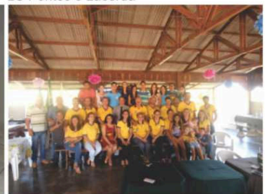
LC Nova Bandeirantes