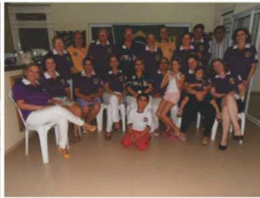
LC Cuiabá Boa Esperança