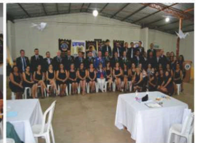
LC Pontes e Lacerda