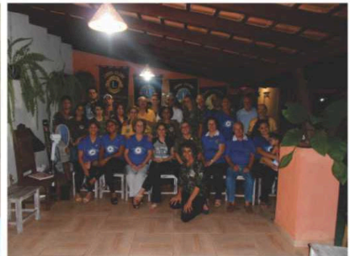
LC Amigos da Lama